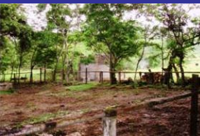
La finca con la casita de bomba al fondo