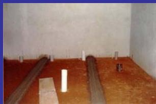
Dentro del cuarto de baño nuevo

Cristo Salva c/o Oak Grove Church 11211 SW 102 Avenue Miami, FL 33176