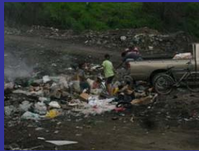
El basurero cerca de Quimistán