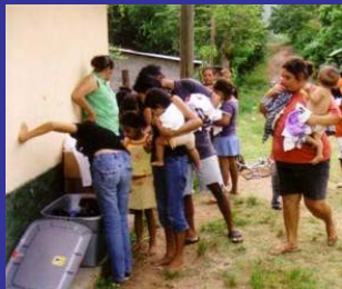
Distribución de ropa