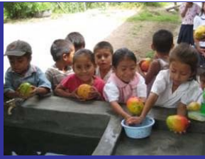
Niños en El Chilar