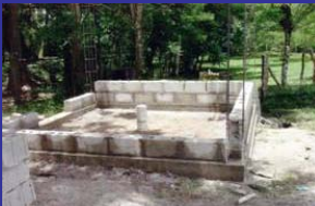
Comienzo de la casita de bomba