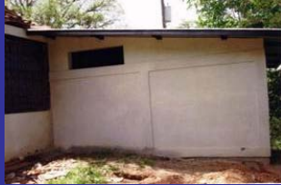
Cuarto de baño y duchas nuevas para los hombres junto a la capilla