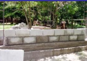
Casita de bomba