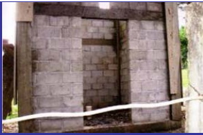
Casita de bomba